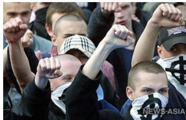
В Костроме скинхеды напали на неформалов