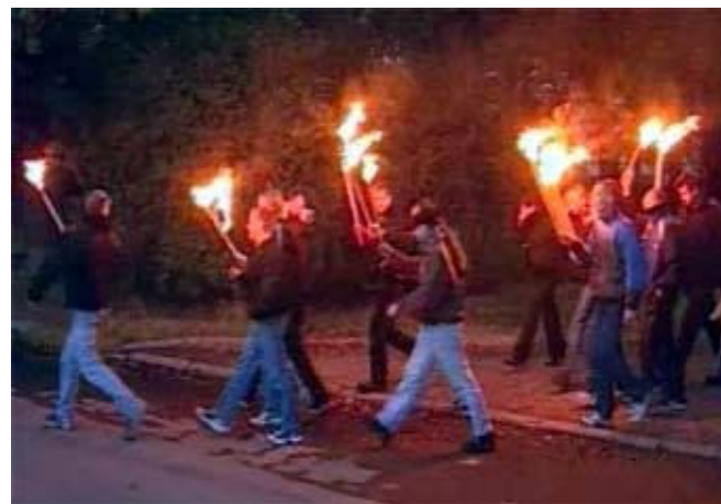
Скинхеды. Факельное шествие в Петербурге.